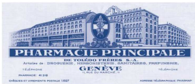
En-tête du papier à lettre de la Pharmacie Principale dans les années 40.