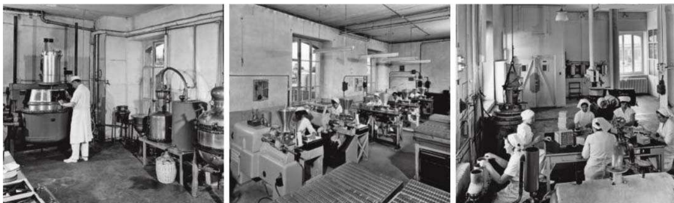
Vues des laboratoires de la Pharmacie Principale à Sécheron où étaient fabriqués les produits pharmaceutiques Médial, années 60.